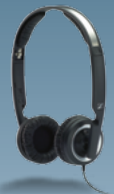
Fernbedienung PX 200-III