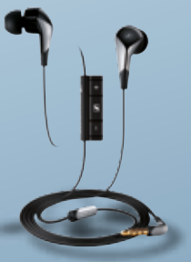
Fernbedienung CX 880i