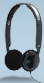
Fernbedienung PX 100-III