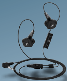
Fernbedienung IE 8i